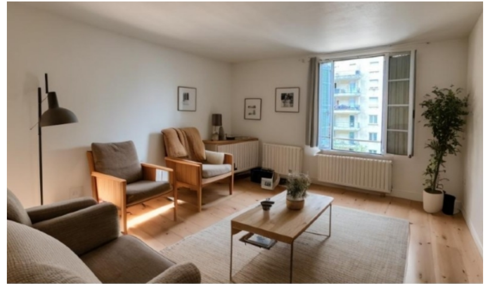
Proposition d'aménagement virtuel non contractuelle