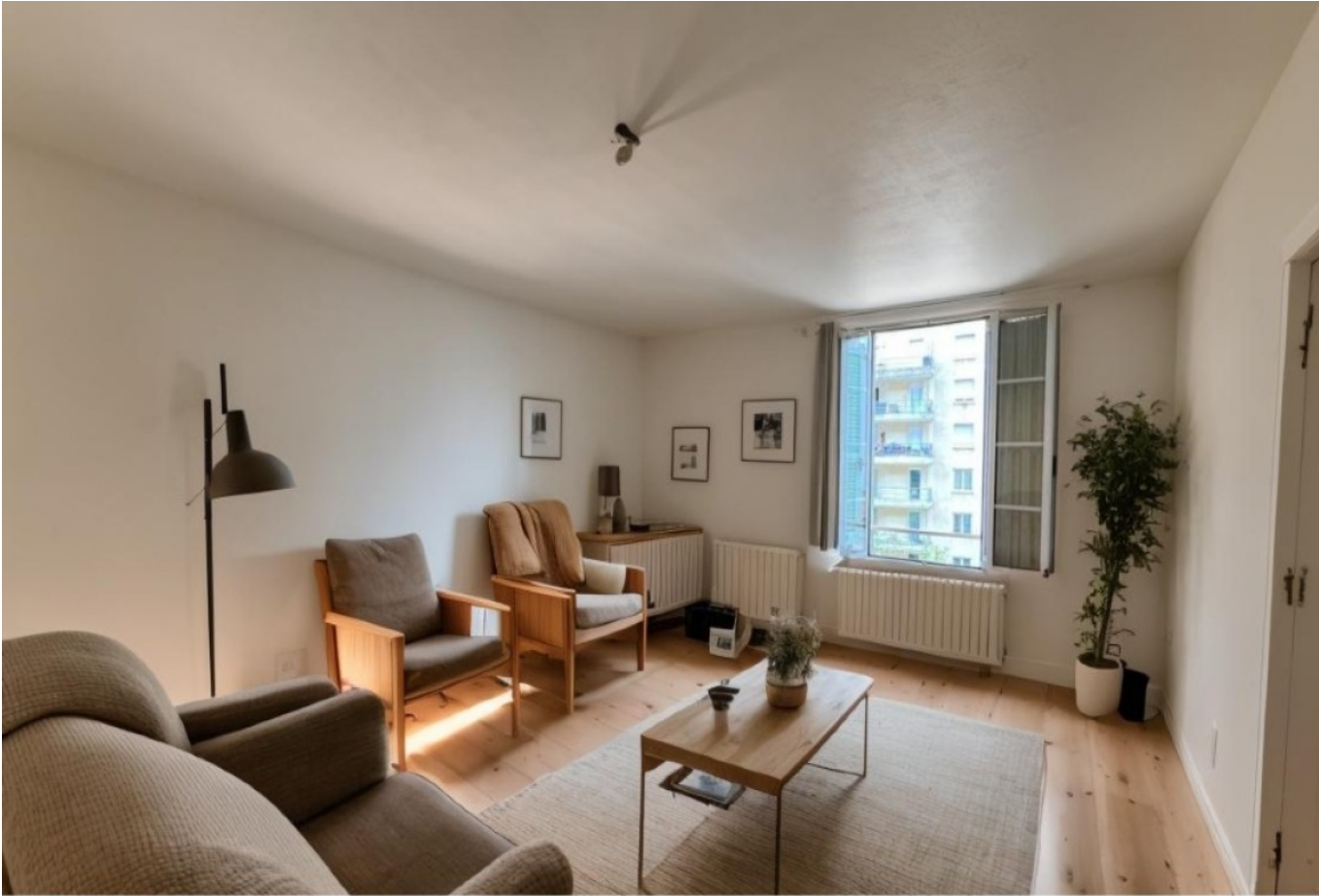
Proposition d'aménagement virtuel non contractuelle