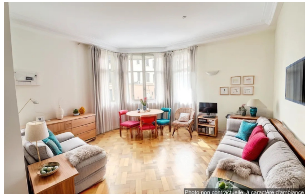
Photo non contractuelle, à caractère d'ambiance