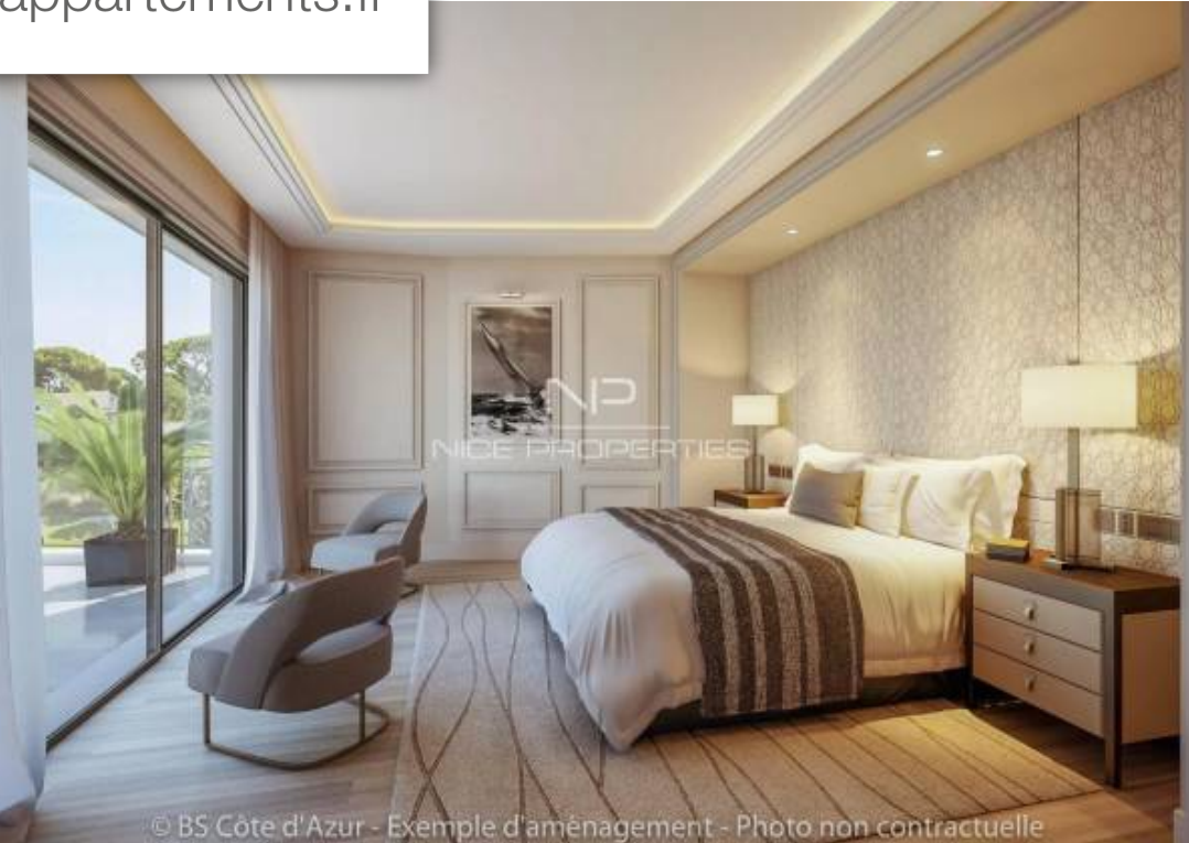
© BS Côte d'Azur - Exemple d'aménagement - Photo non contractuelle