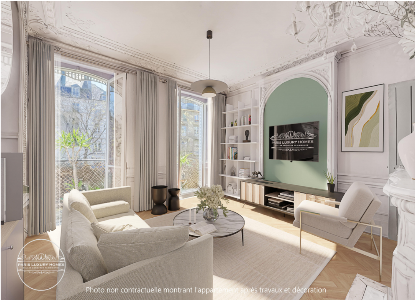
Photo non contractuelle montrant l'appartement après travaux et décoration