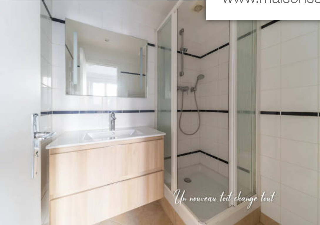
Un nouveau toit change tout