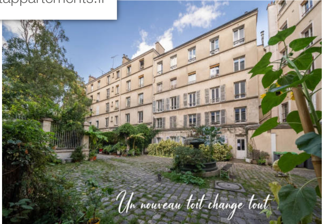
Un nouveau toit change tout