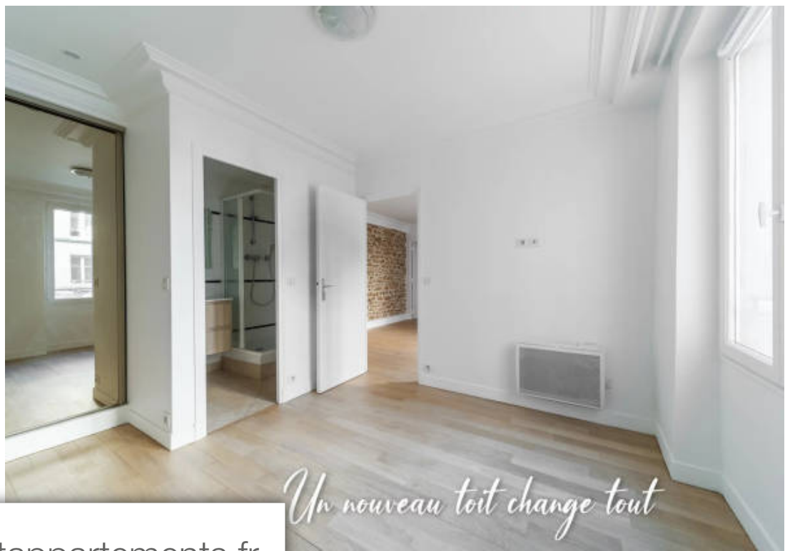
Un nouveau toit change tout