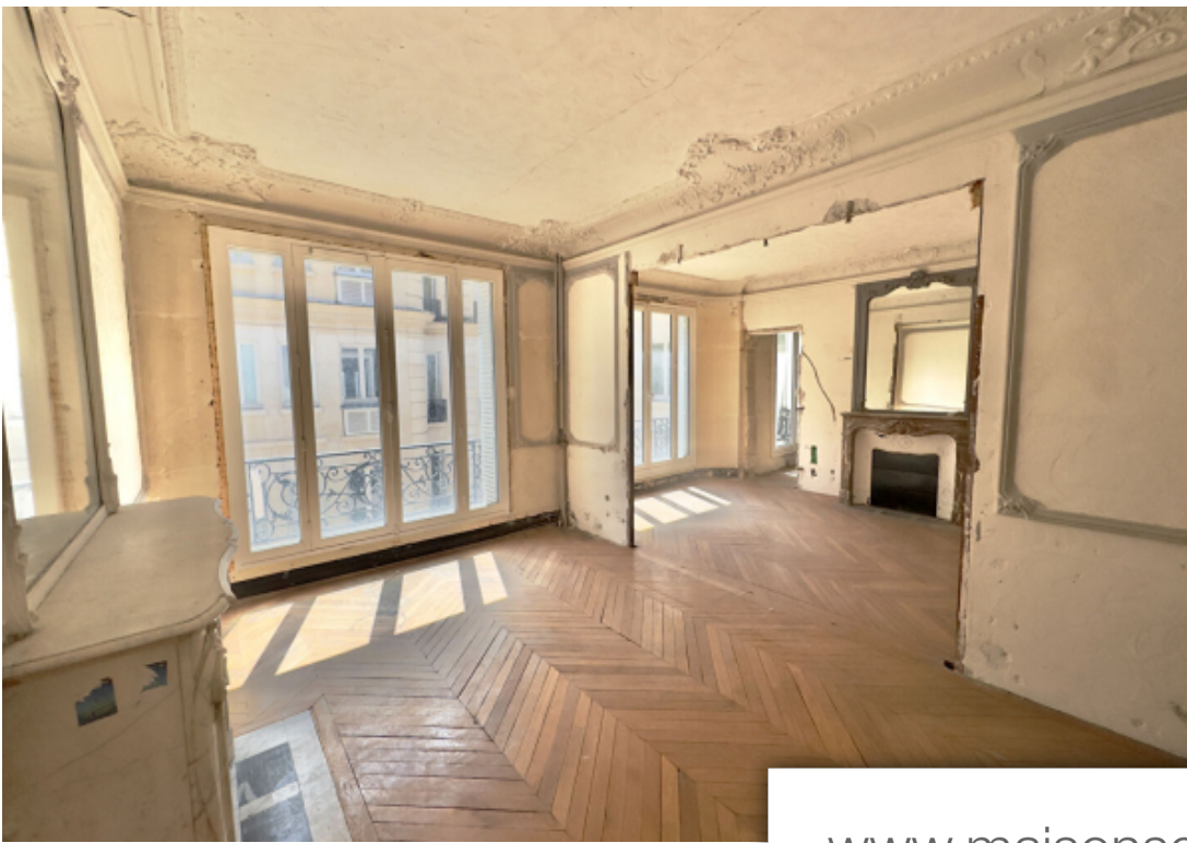
VUE CHAMBRE 1