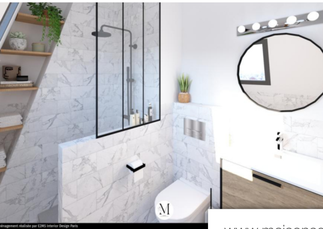
aménagement réalisé par E2MS Interior Design Paris