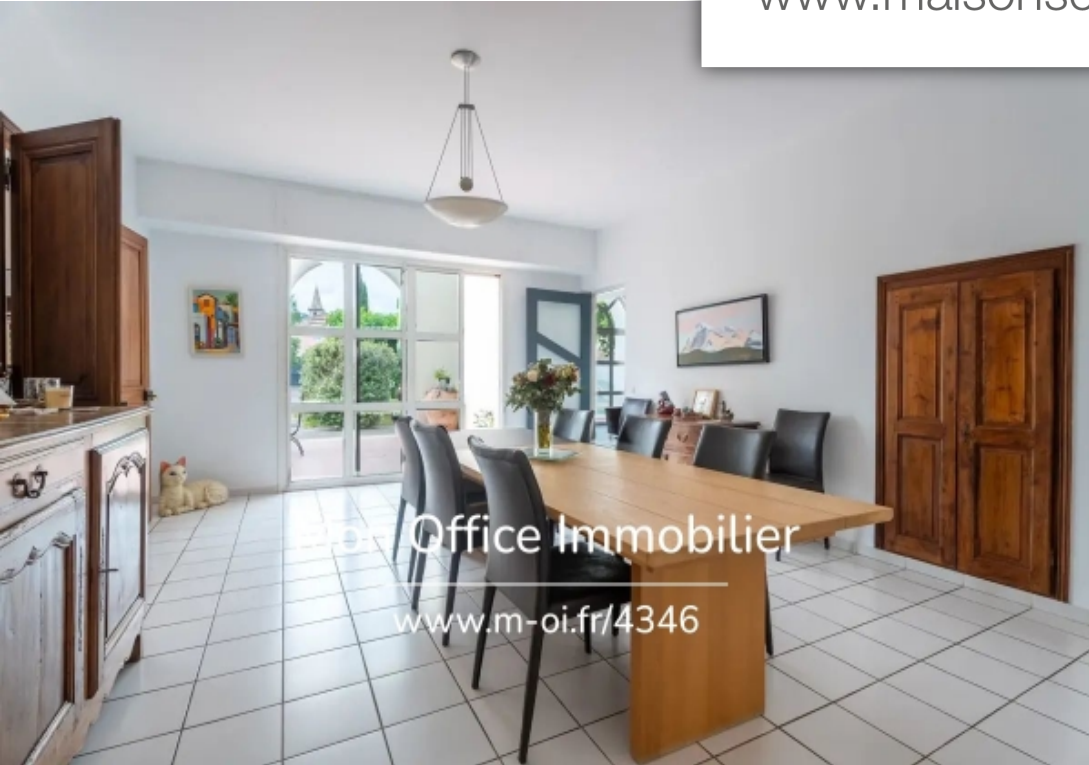
Mon Office Immobilier www.m-oi.fr/4346