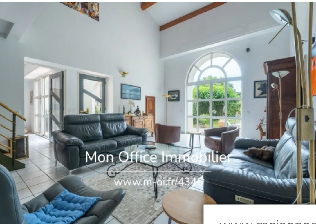
Mon Office Immobilier www.m-oi.fr/4346