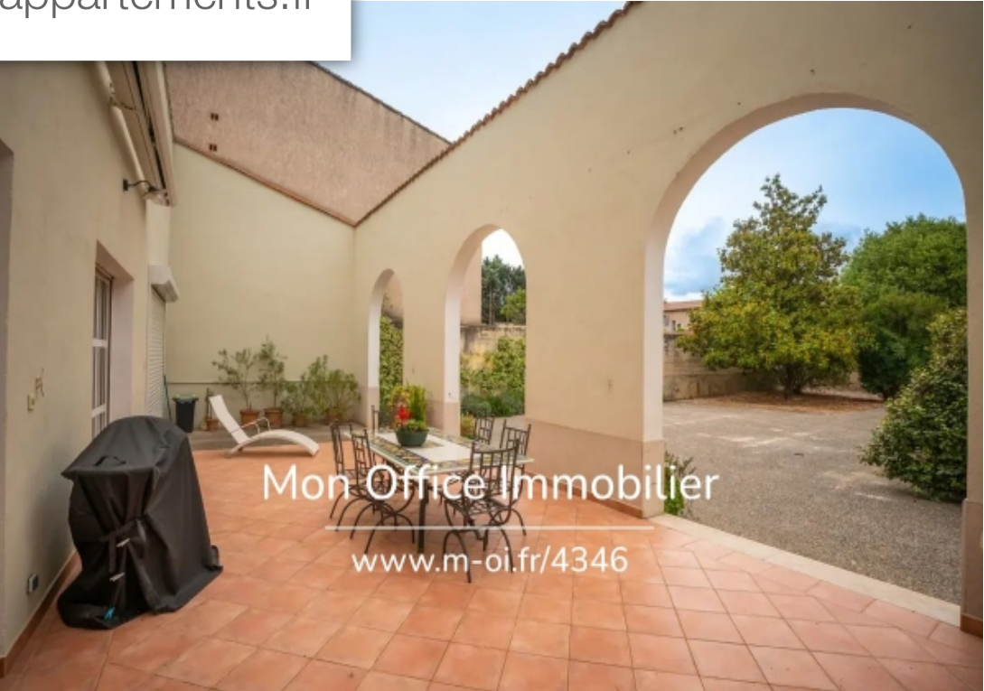
Mon Office Immobilier www.m-oi.fr/4346