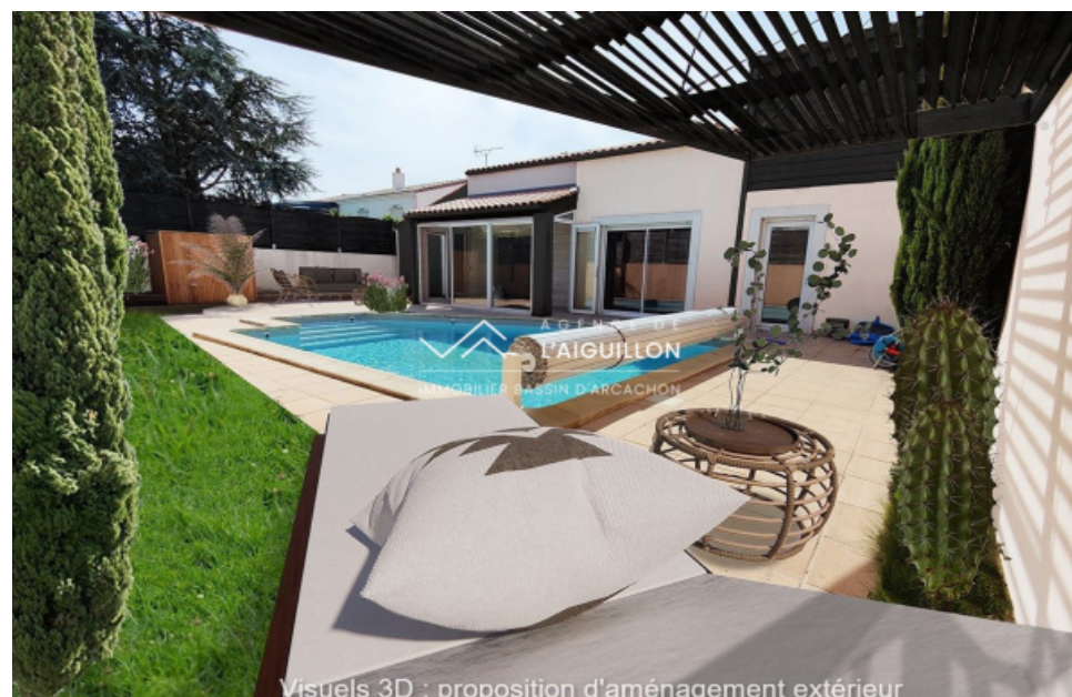
Visuels 3D : proposition d'aménagement extérieur