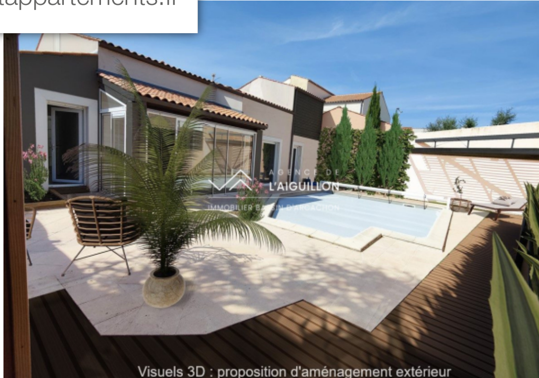
Visuels 3D : proposition d'aménagement extérieur