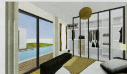
Une suite parentale de 18m 2 au RDC