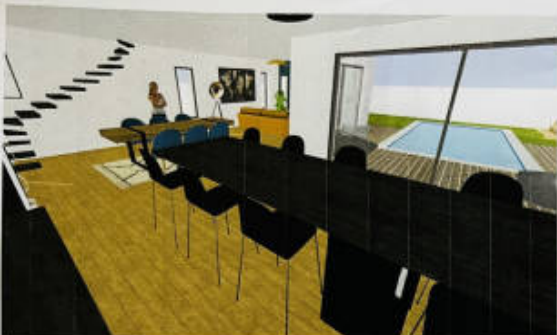
Une pièce de vie avec cuisine centrale de plus de 70 m 2